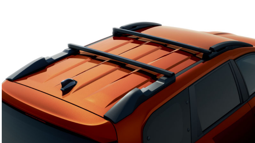
MODULÁRNÍ STŘEŠNÍ LIŠTY

zavazadlového prostoru přispívající k dobrému přístupu. S výbavou Extreme prožijte dobrodružství naplno: lemy kol, disky z lehkých slitin, zpětná zrcátka a anténa ve tvaru žraločích ploutve v černé barvě. Speciální polepy a ochranné lišty v šedé barvě. Nová Dacia Jogger, stvořena pro vás a váš aktivní život.