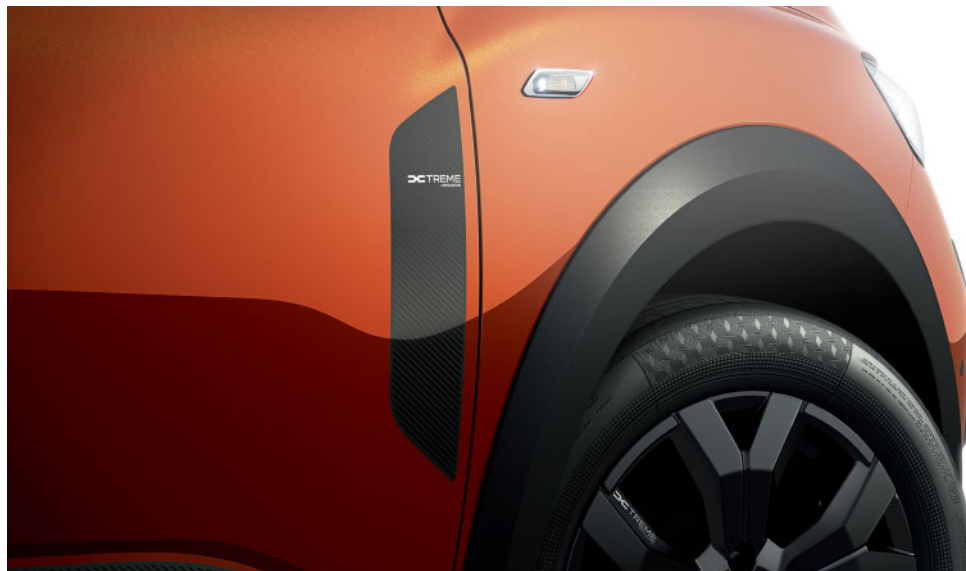
DISKY KOL Z LEHKÝCH SLITIN A ČERNÉ LEMY KOL