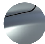
ŠEDÁ COMÈTE (1)