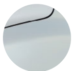
ŠEDÁ MOONSTONE (1)