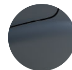
ČERNÁ NACRÉ (1)