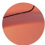
HNĚDÁ TERRACOTTA (1)