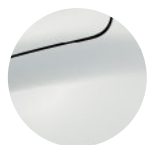
BÍLÁ GLACIER (2)