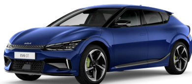
Modrá Yacht (DU3)